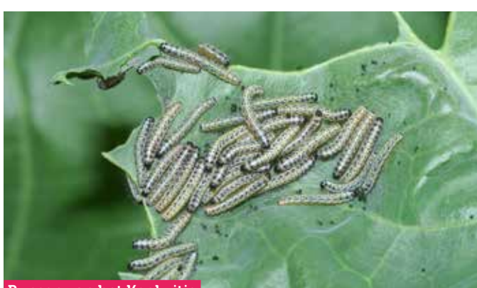
Rupsen van het Koolwitje

De materialen zijn altijd direct klaar voor gebruik en er zit een duidelijke docentenhandleiding bij. Als je eventueel zelf nog materiaal moet regelen, dan staat dat er altijd duidelijk bij vermeld.