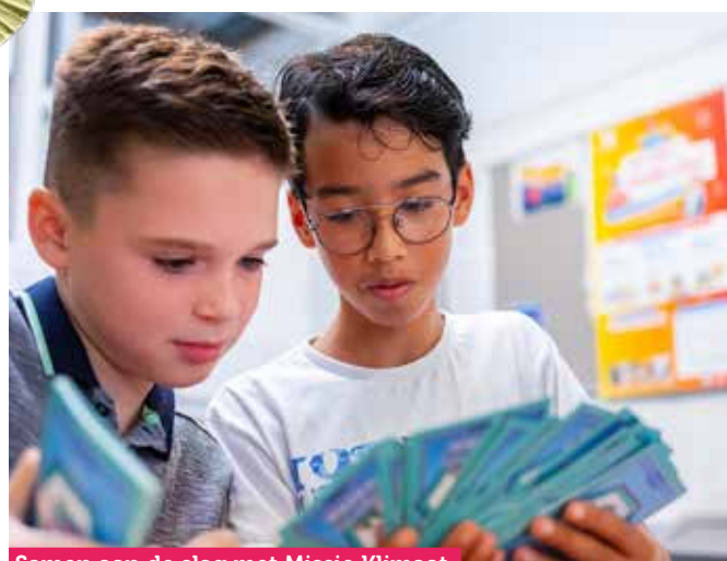
Samen aan de slag met Missie Klimaat

Ga je samen met je klas actief aan de slag met burgerschap en klimaatverandering. De leerlingen leren in 4 rondes en 8 spellen spelenderwijs over klimaatverandering, de bijbehorende gevolgen én mogelijke oplossingen. Wil je het groots aanpakken? Sluit dan deze lessenserie af met een heus klimaatfestival bij jouw op school. De spelonderdelen kunnen ook los gespeeld worden.