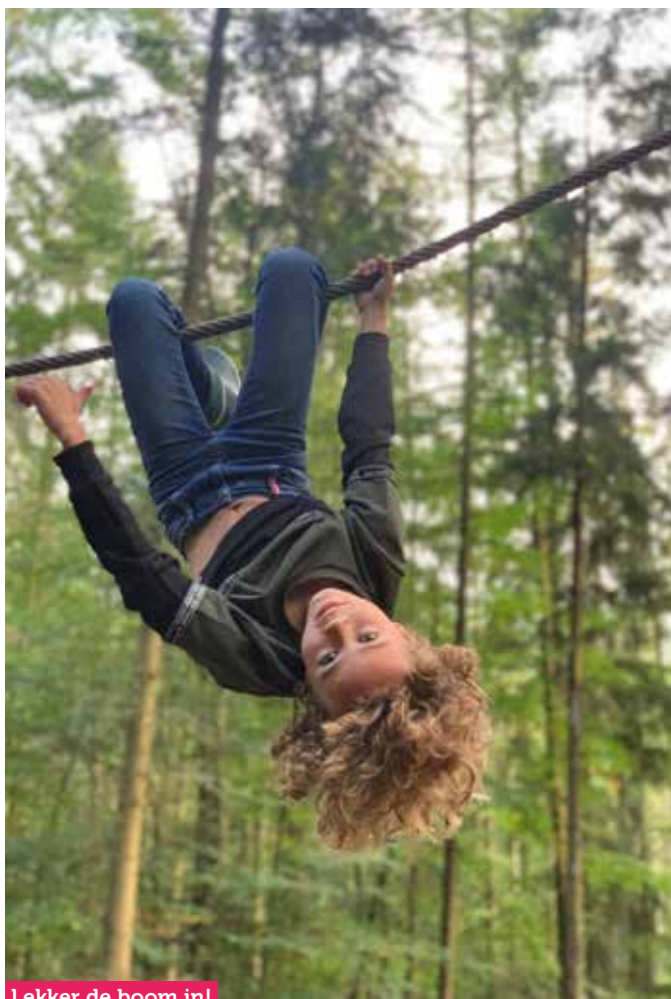
Lekker de boom in!